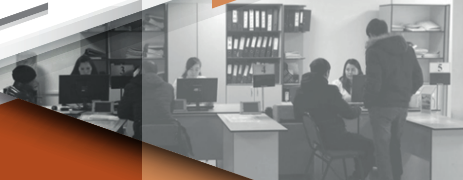
Жылыой ауданының жұмыспен қамту орталығы